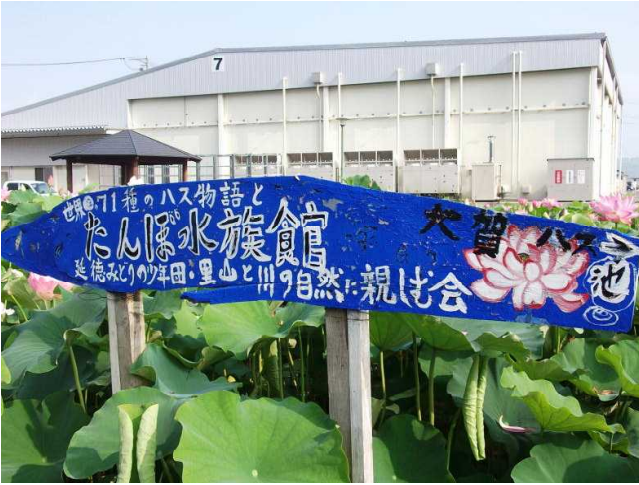
↑ 田んぼ水族館の看板 (今は少しペンキがとれています)

延徳小近くの真引川沿いの田んぼを、地元の有志の人達で組織している「里山と川の自然に親しむ会」のみなさんが整備したもの。大賀ハスの他に世界の各種のハス等が植えられています。