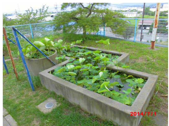
壁画の下 校舎脇にある池 ↑