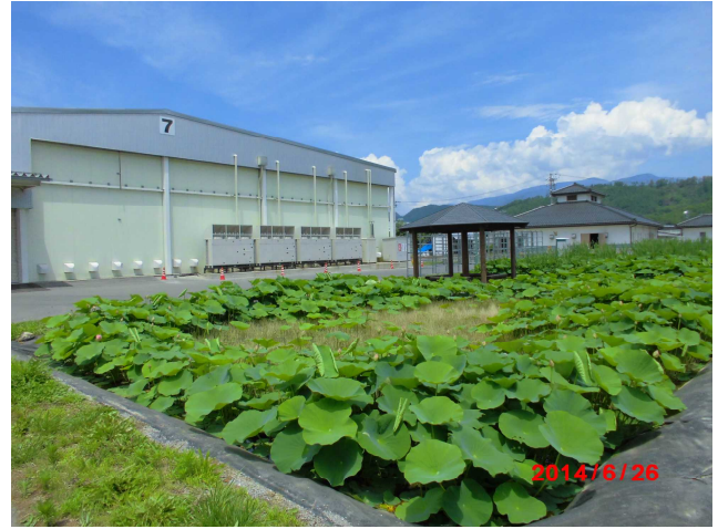
屋根付きの休憩所↑もあります