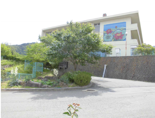
↑大きな木の下に池があります (校門の外)